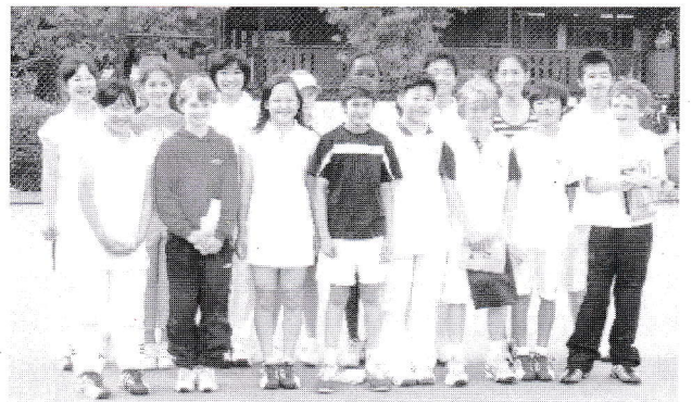
マナーキッズ大使海外派遣